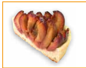
1 Stück Obstkuchen (Hefeteig) 100 g: 164 kcal