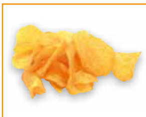
1 Portion Chips 25 g: 141 kcal