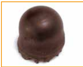
1 Schokokuss 28 g: 93 kcal

Quelle: DGExpert, Version 1.6.7.1 (BLS 3.02)