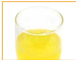
1 Glas Limonade 0,2 l: 84 kcal