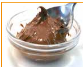
1 TL Nuss-Nougat Creme 10 g: 54 kcal