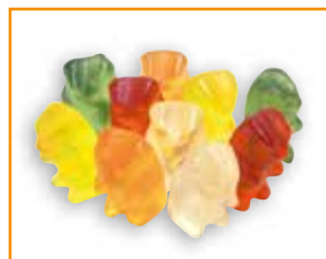
10 Gummibärchen 20 g: 70 kcal

Energiegehalte verschiedener Süßigkeiten und Knabbereien: